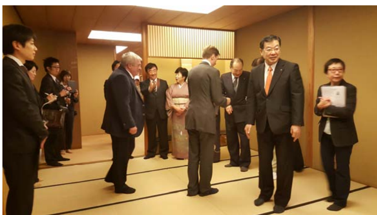
Rencontre avec le Gouverneur de Kyoto